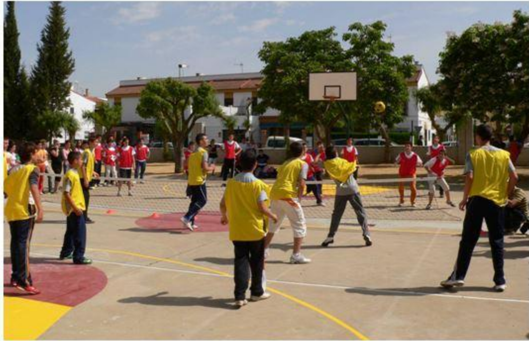
Alumnos del IES "Jesús del Gran Poder" durante un partido de PINFUVOTE

Por el contrario, en cada una de las zonas (delantera y trasera), existe libertad de movimientos y posiciones entre los jugadores durante el set.